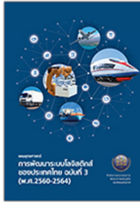
แผนยุทธศาสตร์การพัฒนา ระบบโลจิสติกส์ ของประเทศไทย ฉบับที่ 3 (พ.ศ. 2560-2564)