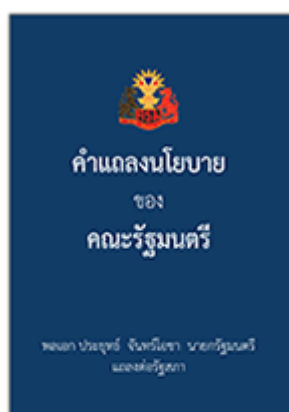
คำแถลงนโยบาย ของคณะรัฐมนตรี