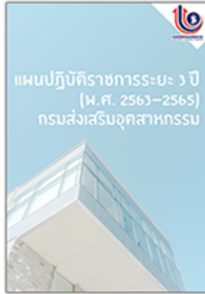
แผนปฏิบัติการราชการระยะ 3 ปี (พ.ศ. 2563-2565) กรมส่งเสริมอุตสาหกรรม