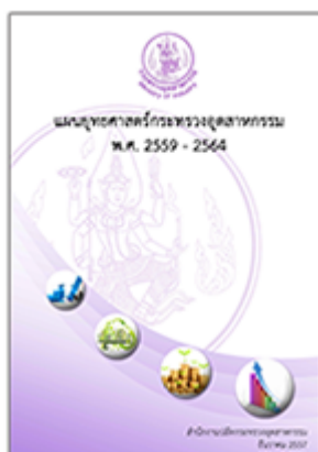
แผนยุทธศาสตร์ กระทรวงอุตสาหกรรม พ.ศ. 2559-2564