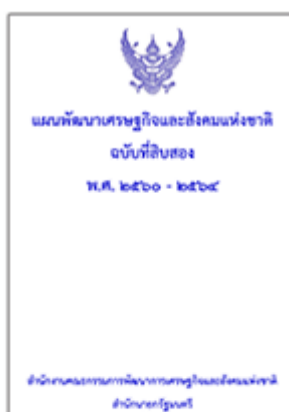
แผนพัฒนาเศรษฐกิจ และสังคมแห่งชาติ ฉบับที่สิบสอง (พ.ศ. 2560-2564)