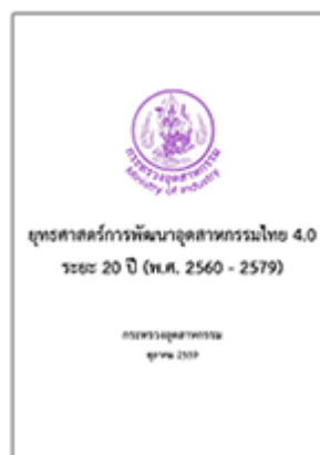
ยุทธศาสตร์การพัฒนา อุตสาหกรรมไทย 4.0 ระยะ 20 ปี (พ.ศ. 2560-2579)