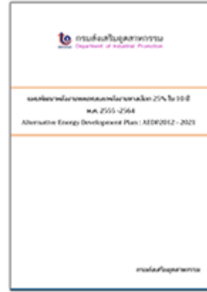
แผนพัฒนาพลังงาน ทดแทนและพลังงาน ทางเลือก 25% ใน 10 ปี (พ.ศ. 2555-2564)