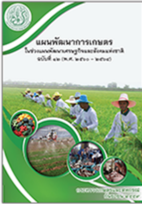
แผนพัฒนาการเกษตร ในช่วงแผนพัฒนาเศรษฐกิจ และสังคมแห่งชาติฉบับที่ 12 (พ.ศ. 2560-2564)