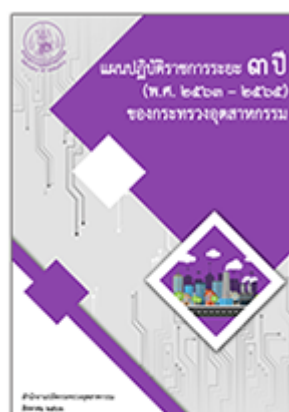
แผนปฏิบัติการระยะ 3 ปี (พ.ศ. 2563-2565) กระทรวงอุตสาหกรรม