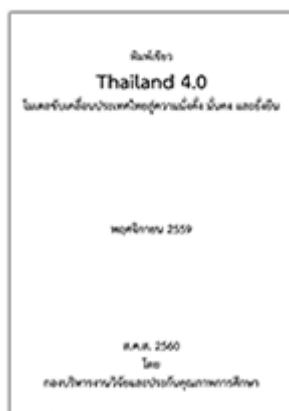
พิมพ์เขียว Thailand 4.0 โมเดลขับเคลื่อนประเทศไทย สู่ความมั่งคั่ง มั่นคง และยั่งยืน